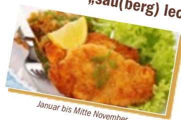
Januar bis Mitte November

Probieren Sie verschiedene Schnitzelvariationen mit Beilagen und einem 0,2l Bier oder alkoholfreien Getränk je 11,99 € p.P.