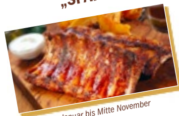
Januar bis Mitte November

Genießen Sie ofenfrische Fleischrippchen soviel Sie mögen, dazu hausgemachte Barbecue- Soße, Kartoffelecken mit Dip und traditioneller Salat 13,99 € p.P.