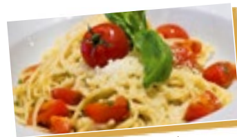
Januar bis Mitte November

Schlemmen Sie Ihre Lieblingspasta inkl. eines Topfes Kaffee oder eines Espressos je 10,99 € p.P.